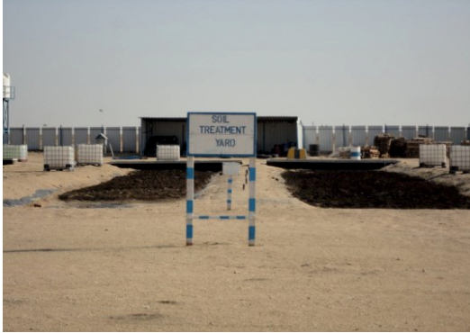
Zona de tratare a solului în zona operațională West Kuwait