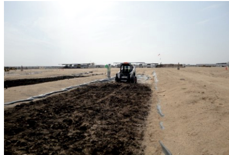
Pregătire sol pentru aplicarea tratamentului