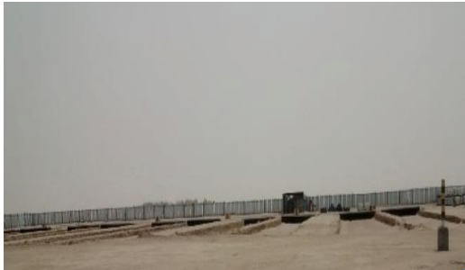
Zona de tratare a solului și a nămolului contaminat cu hidrocarburi