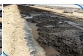
Adăugarea apei pentru menținerea gradului de umiditate

Societatea ECO DEM COLLECT este preocupată de realizarea unei cercetări continue cu scopul găsirii și implementării celor mai bune metode de tratare a solurilor contaminate cu hidrocarburi.