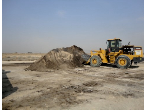
Excavare sol contaminat