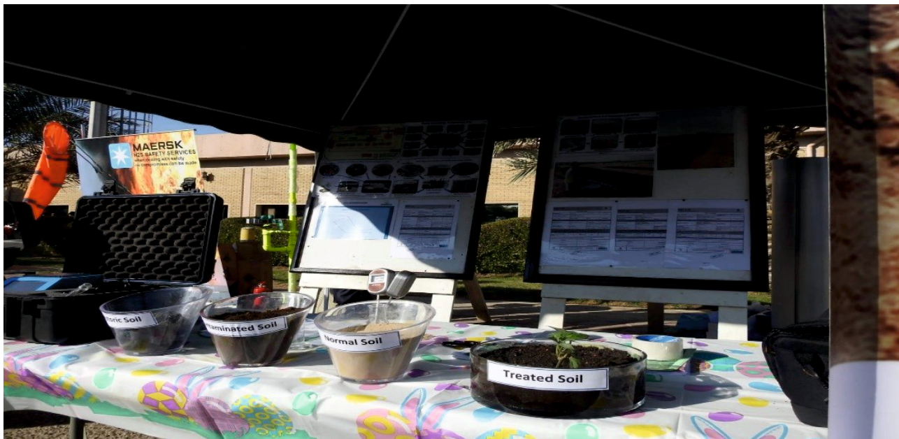
Prezentare rezultate obținute în domeniul bioremedierii solurilor contaminate cu hidrocarburi

Rezultatele aplicării metodelor de bioremediere au fost prezentate în numeroase rânduri în cadrul conferințelor, workshop-urilor, târgurilor de știință, în mod special în zonele interesate de aceste procese. Aceste prezentări au avut un real succes, bucurându-se de aprecierea acordată de către specialiștii în domeniu.