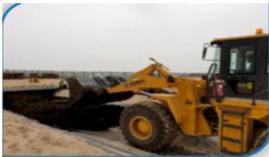
Pregătire pentru construirea tunelului